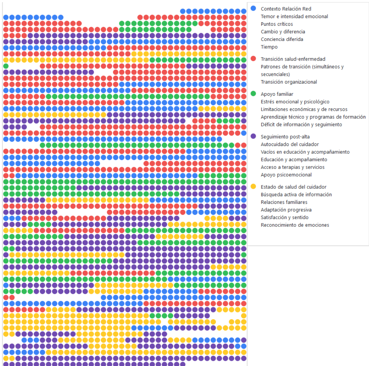
Ilustración 1. Distribución y co-ocurrencia de categorías y subcategorías en entrevista a cuidadores familiares