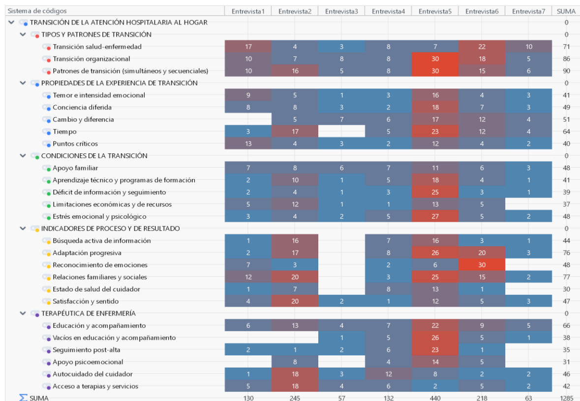
Ilustración 2. Distribución de códigos por entrevistas: diagrama de calor del análisis cualitativo

Elaboración: Elaboración propia. Diagrama de calor generado a partir del análisis cualitativo fenomenológico de entrevistas, según el método de Colaizzi, con apoyo del software MAXQDA.